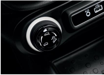
Drive Mood Selector (селектор вибору режиму водіння)