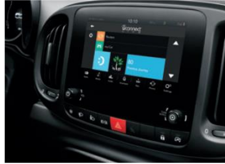
7" кольоровий сенсорний екран, радіо,