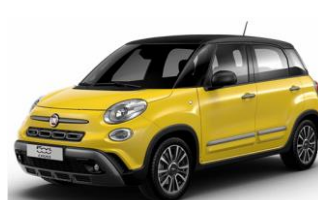
код фарби 970