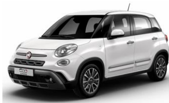
код фарби 268