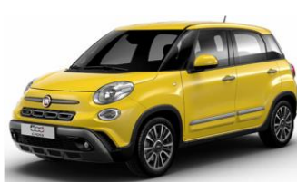
код фарби 830