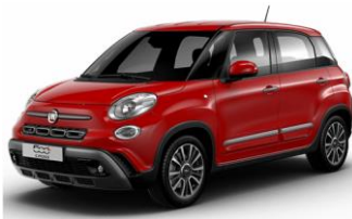
код фарби 111