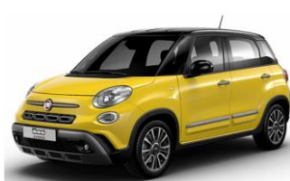
код фарби 828