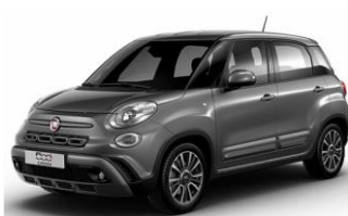
код фарби 609