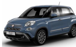
код фарби 652