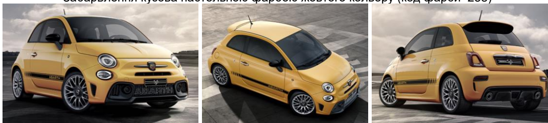
Забарвлення кузова пастельною фарбою жовтого кольору (код фарби 258)

Виробник або продавець залишає за собою право зміни комплектацій та цін на автомобілі без попереднього повідомлення.