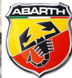
FIAT 595 ABARTH Turismo