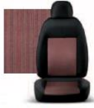
PIN STRIPE ROSSO 203