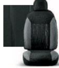
POP OLONA GRIGIO 301