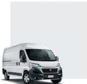
549 Bianco Ducato