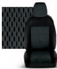
STAR GRIGIO 213