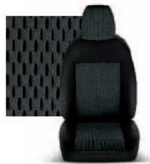
STAR GRIGIO 213