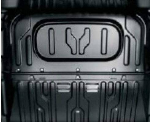
Глуха перегородка для версії з 3-х містим салоном