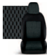
STAR GRIGIO 213