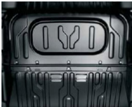
Глуха перегородка для версії з 3-х місним салоном