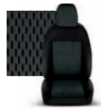
STAR GRIGIO 213