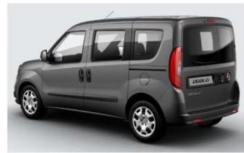
Забарвлення кузова фарбою металік (код 722)