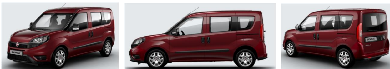
Забарвлення кузова фарбою металік (код 612)