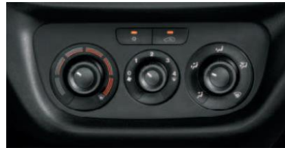
Кондиціонер з ручним регулюванням