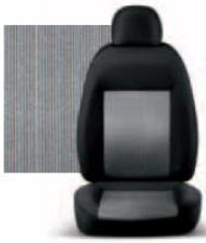
PIN STRIPE GRIGIO 223