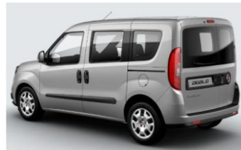
Забарвлення кузова фарбою металік (код 695)