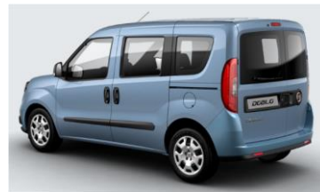
Забарвлення кузова фарбою металік (код 612)