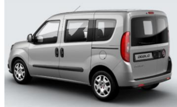
Забарвлення кузова фарбою металік (код 695)