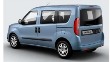
Забарвлення кузова фарбою металік (код 612)