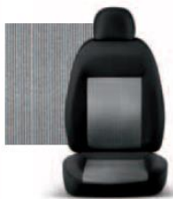
PIN STRIPE GRIGIO 223