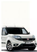
249 - BIANCO

Фарбування кузова пастельною фарбою білого кольору