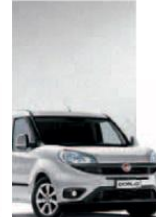
612 - GRIGIO CHIARO