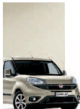
261 - PERLA