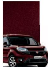
590 - BORDEAUX