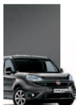
695 - GRIGIO