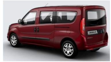
Забарвлення кузова фарбою металік (код 448)