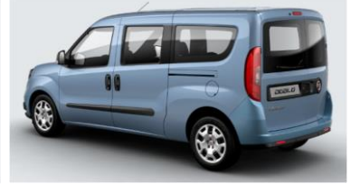
Забарвлення кузова фарбою металік (код 612)