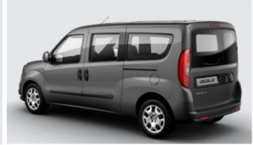
Забарвлення кузова фарбою металік (код 722)