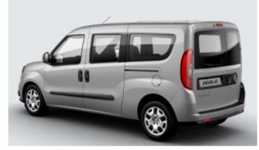
Забарвлення кузова фарбою металік (код 695)