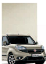
261 - PERLA