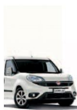
249 - BIANCO

Фарбування кузова пастельною фарбою білого кольору