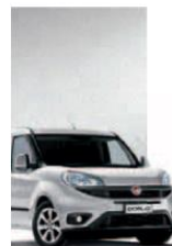
612 - GRIGIO CHIARO