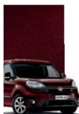
590 - BORDEAUX