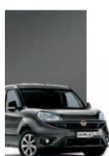
695 - GRIGIO