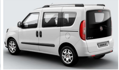
Забарвлення кузова фарбою металік (код 444)