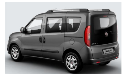
Забарвлення кузова фарбою металік (код 722)