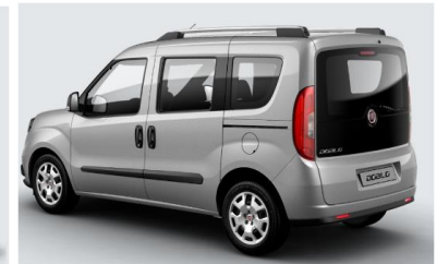
Забарвлення кузова фарбою металік (код 695)