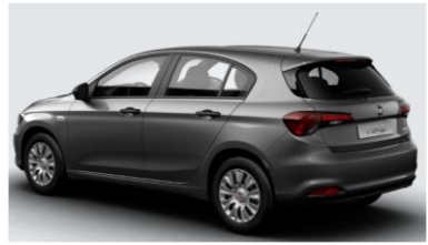
Забарвлення кузова фарбою металік (код 716)