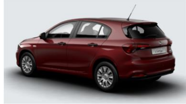
Забарвлення кузова фарбою металік (код 718)