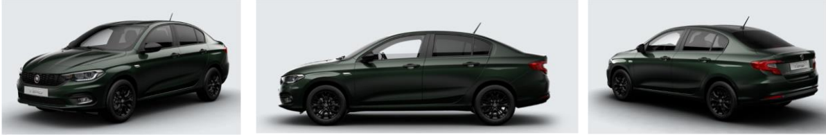
Забарвлення кузова фарбою металік (код 695)