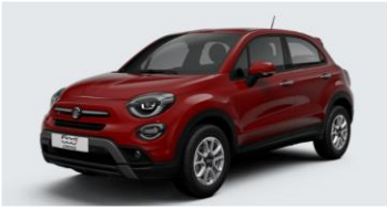
Забарвлення кузова пастельною фарбою червоного кольору (код 289)