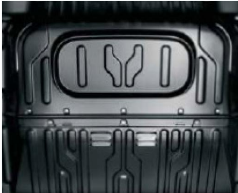
Глуха перегородка для версії з 3-х містим салоном