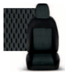
STAR GRIGIO 213