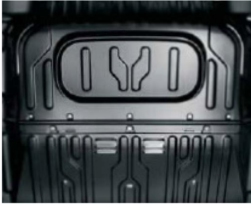
Глуха перегородка для версії з 3-х містим салоном