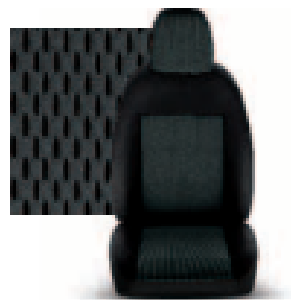
STAR GRIGIO 213

Глуха перегородка з вікном для версії з 3-х містим салоном