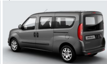
Забарвлення кузова фарбою металік (код 722)