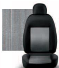
PIN STRIPE GRIGIO 223