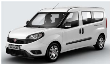
Забарвлення кузова пастельною фарбою білого кольору (код 249)