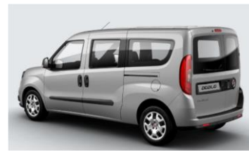
Забарвлення кузова фарбою металік (код 695)