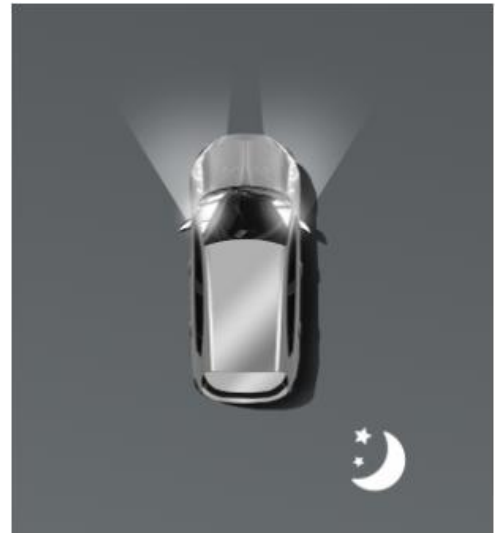
Автоматичне дальнє світло