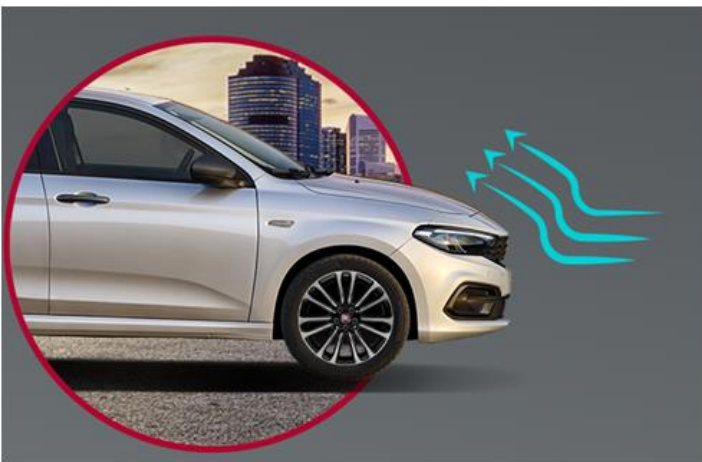
Активна заслонка решітки радіатора